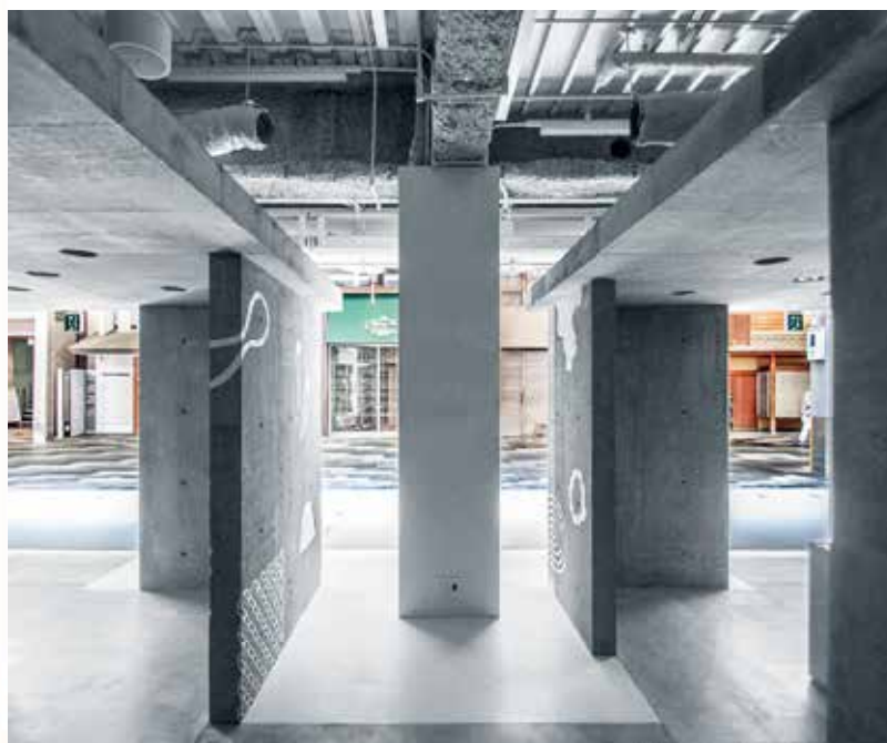
JCD大賞「JINS 京都寺町通店」

詳しくはDSA協会ホームページをご覧ください。 http://www.dsa.or.jp/