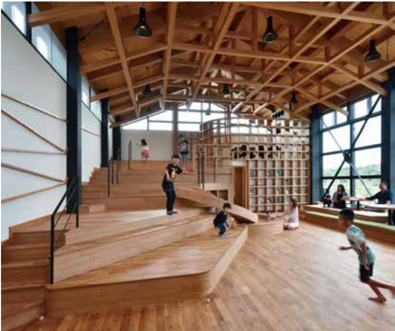
JID大賞「社会福祉法人楓葉の会 椛-MOMIJI」