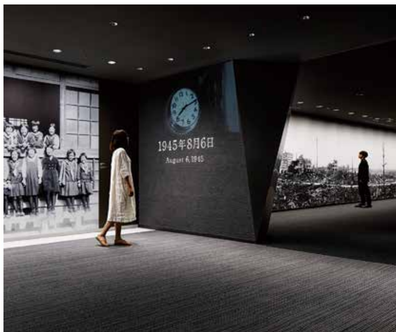
DSA大賞「広島平和記念資料館東館」