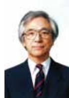
松本哲夫 プロフィール

1912年 東京で生まれる。1932年 東京高等工芸学校木工芸科卒業。仙台商工省工芸指導所入所。ブルーノ・タウト氏、イサム・ノグチ氏と交流。1955年「剣持勇デザイン研究所」設立。1959年 日本室内設計家協会理事長就任～1960。1960年 ホテルニュージャパニー部インテリア・家具デザイン。1961年 熱海ガーデンホテル家具デザイン。1963年 東京ヒルトンホテル 樺グリル・バンケットホール、インテリアデザイン。1964年 藤製バスケットチェア MOMA コレクションに選定。国立代々木競技場 VIP ルーム家具デザイン。1966年 国立京都国際会館、絨毯・家具デザイン。1968年 ヤクルト・ジョア等容器デザイン。1970年 第15回毎日産業デザイン特別賞受賞。日本インテリアデザイナー協会理事長就任～1971。1971年 日本インテリアデザイナー協会賞受賞 (JAL747 機内インテリア)。京王プラザホテル インテリア総括顧問就任、インテリアデザイン・家具デザイン。同年6月3日逝去