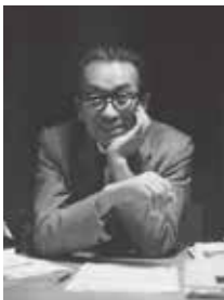
剣持勇の経歴・主な仕事紹介