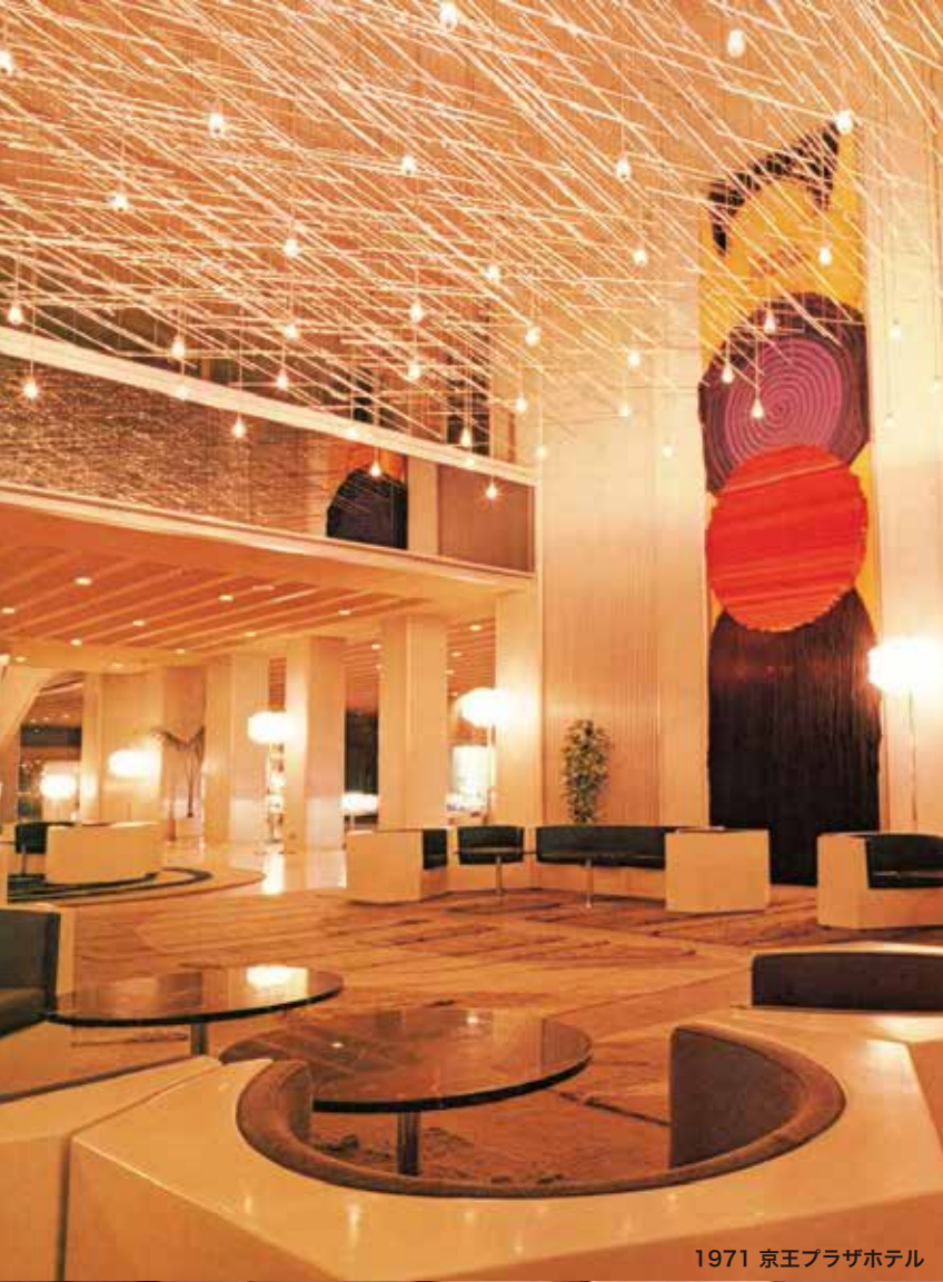
1971 京王プラザホテル